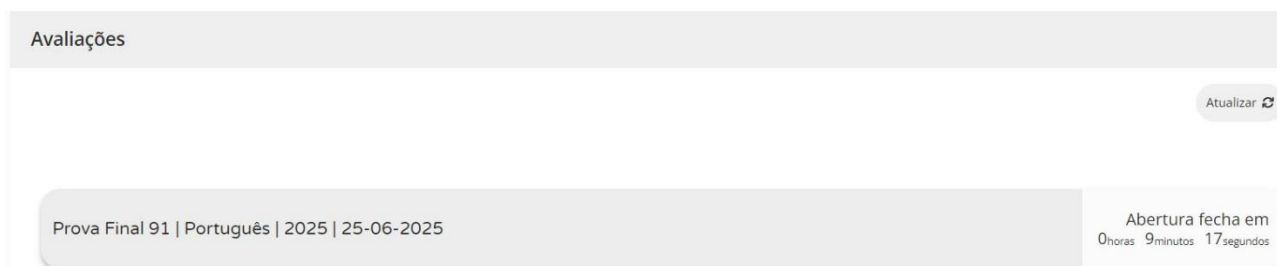
Figura 2 – Acesso à prova a realizar

11.12. Para aceder à prova, o aluno tem de clicar em cima da zona cinzenta onde se encontra escrito o nome da prova.