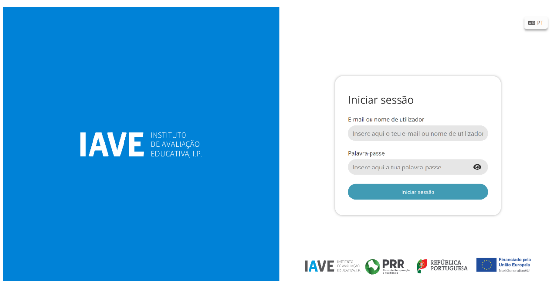
Figura 1 – Acesso à Plataforma de Realização de Provas do IAVE

( Obs.: Para as escolas que optaram pelo offline em rede ou standalone, os procedimentos para acederem à Plataforma de Realização de Provas do EduQA são os constantes no Manual Offline, publicado na Área Escolas do JNE);